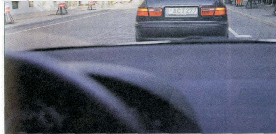
Mirksėdami posūkių žibintais, vairuotojai kelyje padėkoja arba atsiprašo.